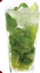
HUSETS DRINK Mojito 99:-