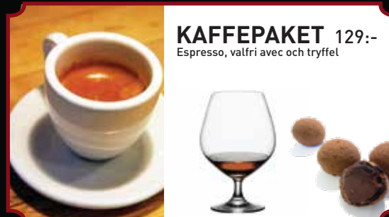
KAFFEPAKET 129:- Espresso, valfri avec och tryffel